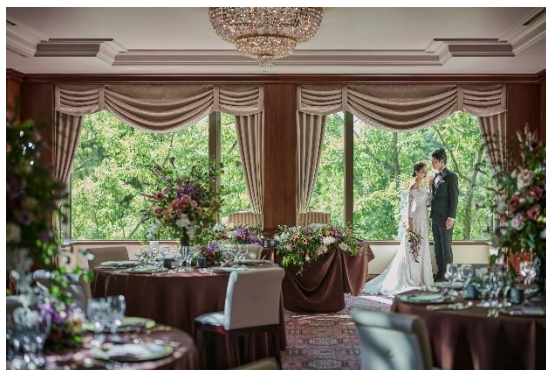
披露宴会場「クリスタル」