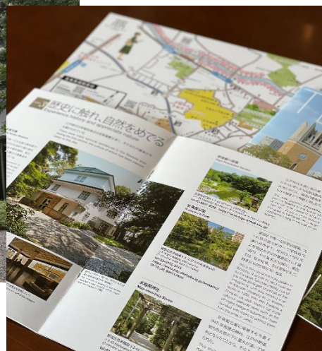
近隣散策ガイド 「TEKUTEKU 早稲田界限ノスタルジックさんぽ」 &マップ

ホテルから徒歩約7分の場所に位置する「永青文庫」で、早春展として開催される「揃い踏み 細川の名刀たちー永青文庫の国宝登場ー」の観覧チケット付きの宿泊プランです。