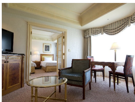
ジュニアスイート ツイン（49.1㎡） イメージ