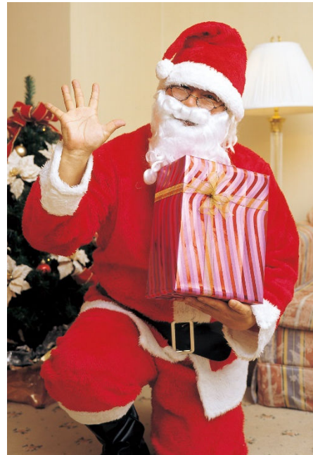
サンタクロースイメージ

③女子会プラン「ガールズクリスマス」(*)は、クリスマスシーズンに華やかなホテル女子会を。ご友人や姉妹、母娘など気心の知れている女性同士で忘年会も兼ねてゆっくりとホカンスを満喫していただけるプランです。