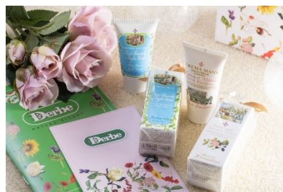
Derbe（デルベ）ハンドクリーム イメージ