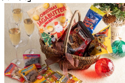
お菓子バスケットイメージ