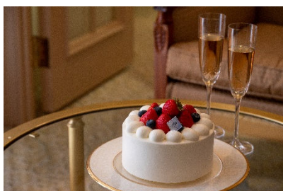
クリスマスケーキとスパークリングワイン イメージ