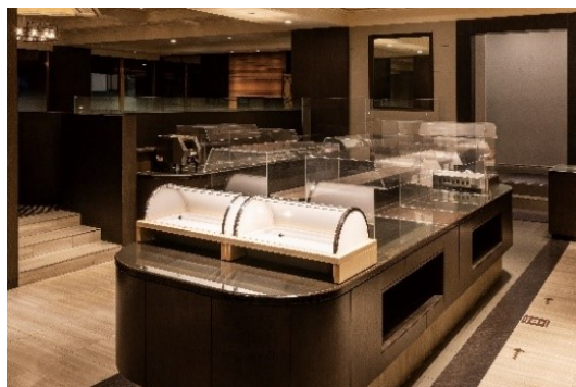
アクリル板を設置したビュッフェ台

料理卓をご利用時は ポリ手袋の着用をお願いします。 ※ポリ手袋はご入店時にお渡しいたします。