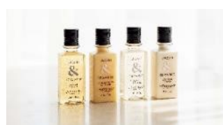
エグゼクティブフロア専用アメニティ (ロクシタン ジャスミン&ベルガモットシリーズ)