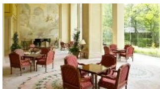
ガーデンラウンジ