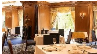
中国料理 皇家龍鳳