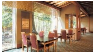
京料理 たん熊北店 Directed by M.Kurisu