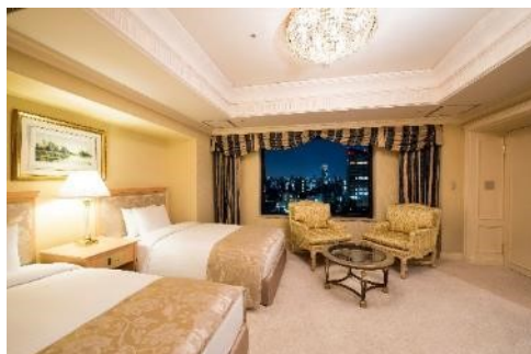
クラウンスイート(73.5㎡)