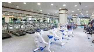
ヘルスクラブ(ジム)