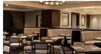
ダイニング フェリオ(朝食のみ営業)