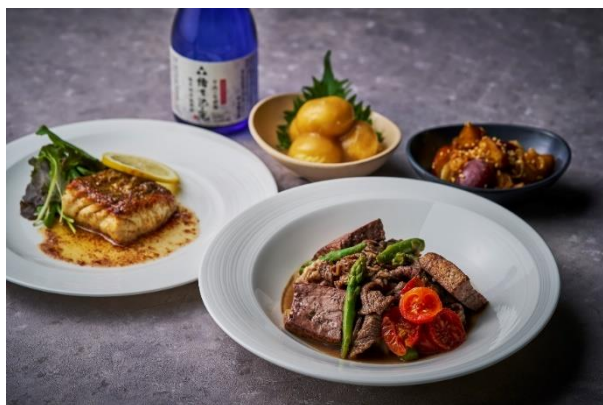
手前より時計回りに、⑧「すき焼き ビストロ風」、 ⑨「スズキのムニエル ガーリック醤油」、⑩日本酒「緒方洪庵」、 ⑪「鶏肉と豆腐のつみれ 柚子胡椒餡」、⑫「葱と薩摩芋の難波煮」