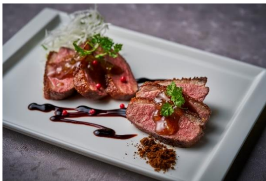
③合鴨ロティ 柚子茶とバルサミコ