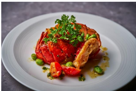
②オマール海老のロースト ブールノワゼット