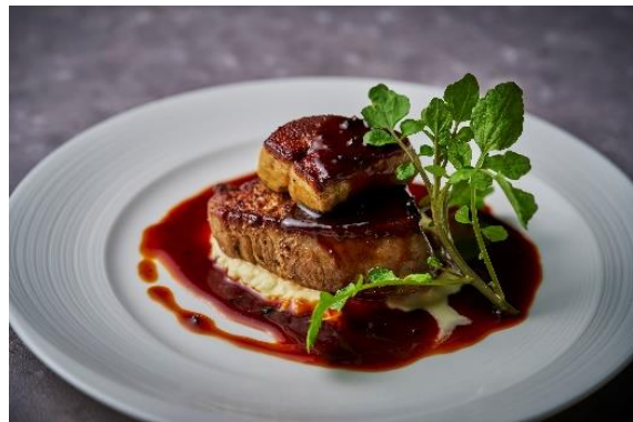
①牛フィレ肉のステーキとフォワグラ「ロッシーニ」