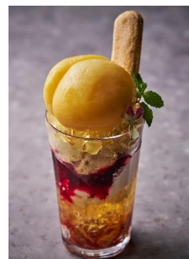
⑦丸ごと桃のパフェ