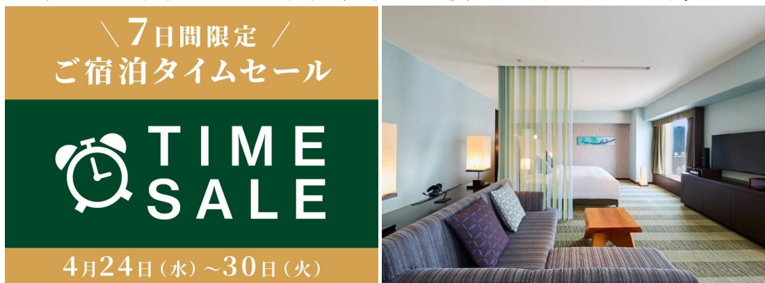
リーガロイヤルホテル (大阪) 客室イメージ