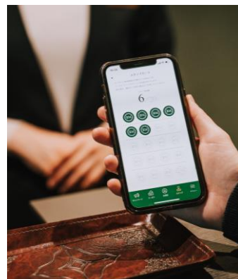
<スタンプカード イメージ>