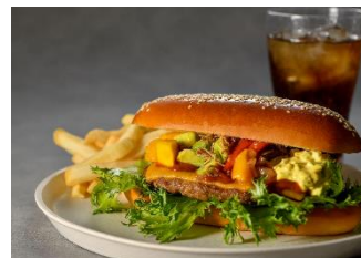
「アゴラバーガー」イメージ

大阪大学中之島センター2階にある「カフェテリア・アゴラ」は、文化・芸術・学術・技術の「4つの知」が交差する広場というコンセプトで誕生しました。店内はさまざまな展示物に囲まれ、ミュージアムのように、ゆったりとお過ごしいただける空間です。コンセプトにちなみ、ラタトゥイユ・アボカド・マンゴー・エッグスプレッドの4種の具材を絶妙にマリアージュさせた、食べ応えのある「アゴラバーガー」などをお楽しみいただけます。