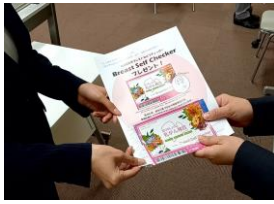
乳がんに対するリテラシー向上の為、自己検診用プレストチェッカーを配布