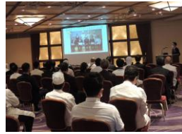
全従業員を対象に外部講師を招いての禁煙セミナーや健康セミナー