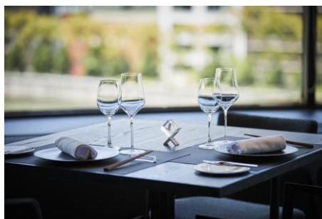
ホテルでのお食事イメージ

「リーガメンバーズ」オフィシャルサイト: https://www.rihga.co.jp/members/rihga-members