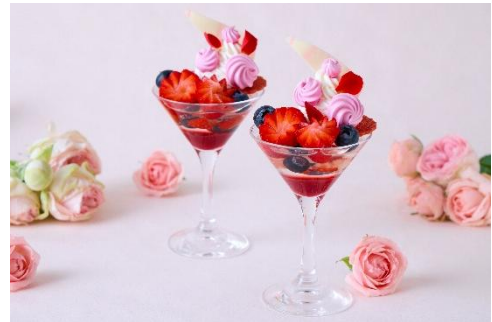
「バラとミックスベリーのミニパフェ」 ※写真は2名様分です

※お米の産地について特別の記載をしていない場合、メニューで使用しているお米は全て国産米です