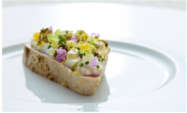
前菜「初鰹と燻香 長芋 蕪 とんぶり 白醤油」 咲き誇る花々のような見た目も華やかなひと品