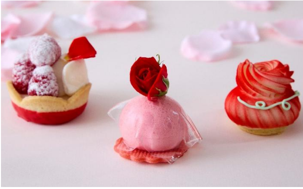
バラとの相性を楽しむスイーツ