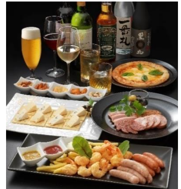
※写真は4名様分のイメージです

※写真はすべてイメージです ※料金は税金・サービス料を含みます ※一部通常販売料金が期間により変わります ※営業時間・休業日はホームページをご確認ください ※食材の入荷状況等によりメニュー内容を変更する場合があります