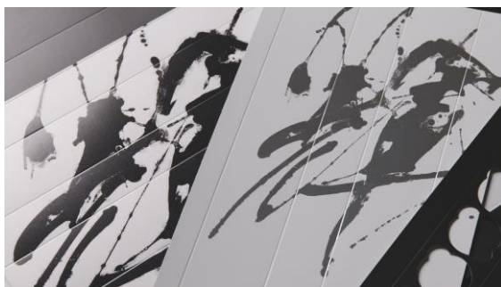
川尾氏による、躍動感溢れる“輝”。