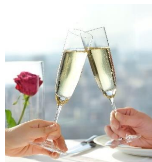
ホテルでのお食事イメージ