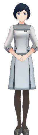
アバター イメージ

ホームページ https://rihgaroyalwedding.com/osaka/