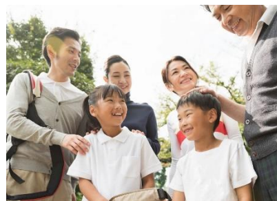
<ファミリー向けプラン>イメージ

※急な天候不良による当日の運休時には、クルーズ乗船券をホテル館内利用券(1名様につき¥2,000分)に変更させていただきます。