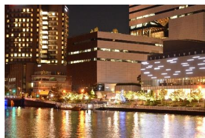
発着：福島(ほたるまち)港 (ホテルから徒歩6分)