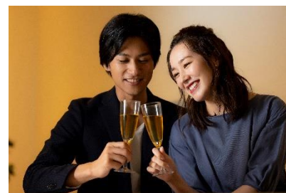
<カップル向けプラン>イメージ