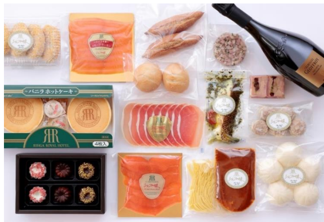
オンラインショップ 商品イメージ