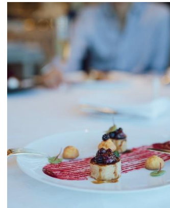
ホテルでのお食事イメージ

グループ全11ホテルの宿泊やレストラン、オンラインショップ等の利用でポイントが貯まり、利用すればするほどお得な特典やサービスを受けられる「リーガメンバーズ」。アプリでは、ホテルの宿泊やレストランを簡単に予約できるほか、お得なクーポン、特別宿泊プラン、レストラン特別メニューなどのキャンペーン情報を定期的に受け取り、利用回数に応じて特典を受けられるスタンプラリー(カード)機能も。よりお得に、より楽しく、よりスマートにホテルをご利用いただけます。