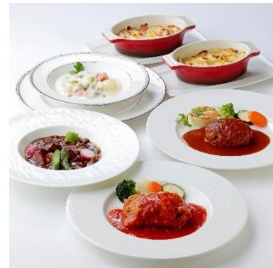
ホテルのグルメギフト イメージ

11月1日(月)から11月30日(火)の期間に、新たに会員登録された方の中から抽選で200名様に、ご家庭でお楽しみいただけるホテルのグルメギフト(10,000円相当)をプレゼントするキャンペーンを実施します(各種条件あり)。