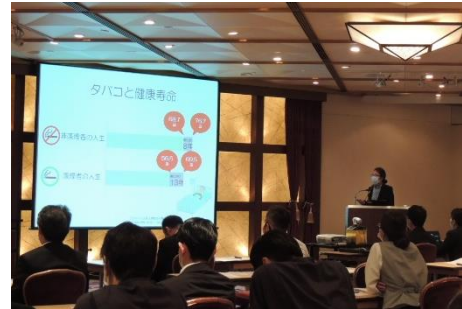
禁煙セミナーの様子

禁煙セミナー実施や、禁煙新聞の定期発行でヘルスリテラシーを向上。禁煙サポーターが寄り添い、サポート体制を充実。禁煙達成者にはインセンティブを付与。