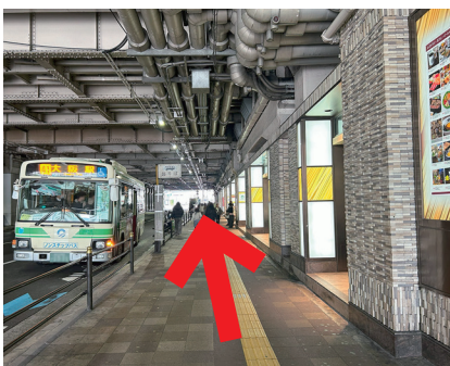
⑯ さらに直進します。