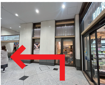
⑩ 突き当たりを 左に曲がります。