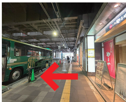
⑰ 緑のコーンが立っている所が、 リーガロイヤルホテル大阪行きの シャトルバス乗り場です。