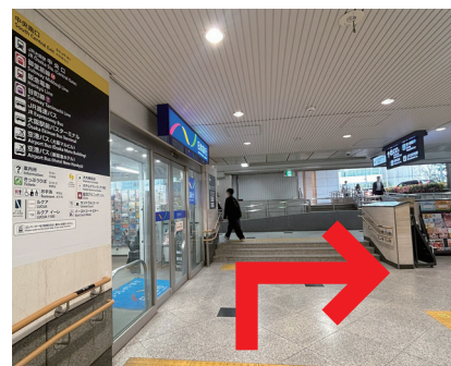
⑫ 右に曲がり、 直進します。