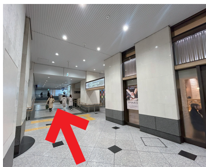
⑪ 直進します (スロープを上る)。