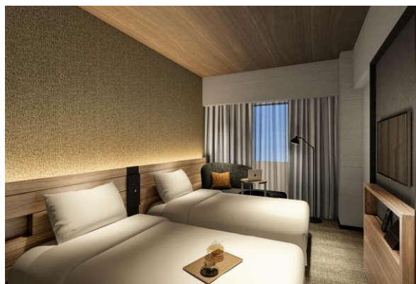
ツイン (イメージパース)