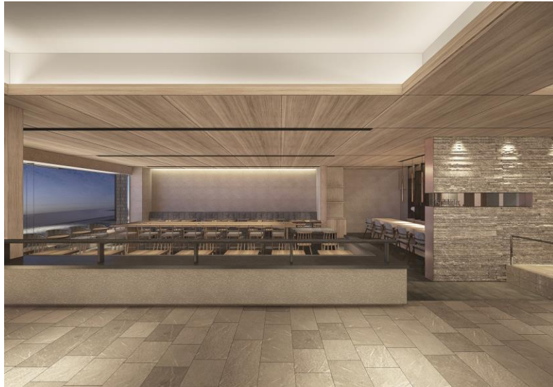
1階「カフェテラス」(イメージパース)