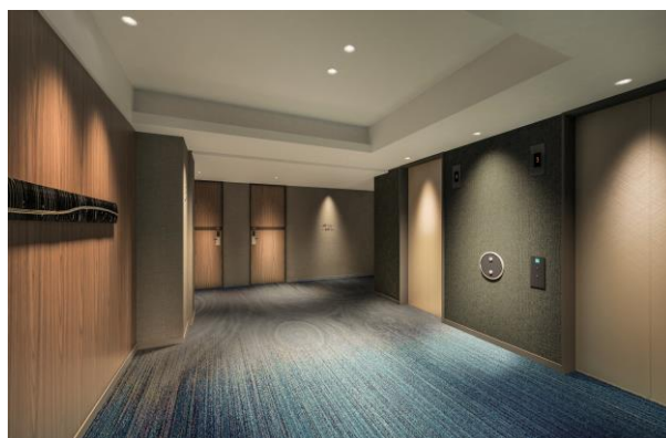
客室エレベーターホール (イメージパース)