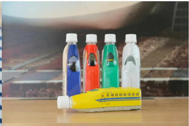
(写真左)ホテルオリジナル アクリルキーホルダー イメージ (写真右)トレインボトルウォーター イメージ