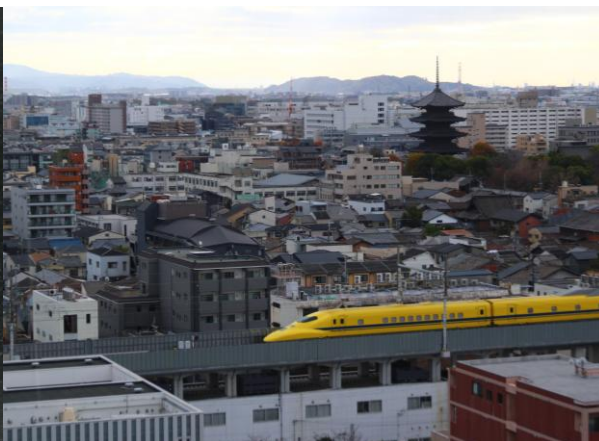
(写真左)923 形ドクターイエローケーキ イメージ (写真右)フレンチダイニングトップ オブ キョウトより撮影

本プランは、鉄道の世界観を存分に愉しめるコンセプトルーム「リーガトレインルーム 776 系」限定の宿泊プランです。お部屋での滞在そのものが特別な体験となる空間で、ホテルパティシエ特製のドクターイエローをイメージしたチョコレートケーキをご用意。鉄道ファンにはもちろん、ご家族や記念日でのご利用に思わず笑顔になるひとときをお届けします。