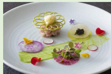
『キハダマグロと帆立貝のタルタル 彩り野菜と 抹茶のチュイール キャビア飾り』イメージ