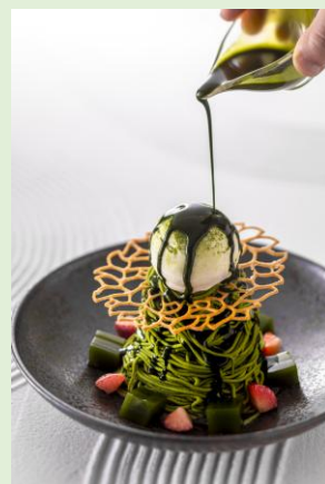
『抹茶の惑星モンブラン』 イメージ

単品:3,036円/ドリンク付き 3,542円(コーヒー、紅茶 または カモミールティー)