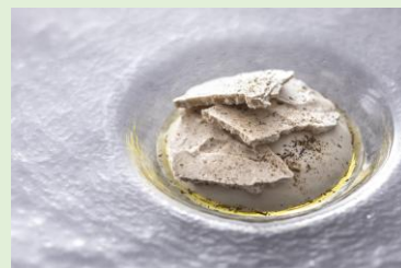
『和東町産ほうじ茶香る久在屋“京ふたり”のムース “由良オリーブを育てる会”より京都産エキストラ バージンオイル』イメージ