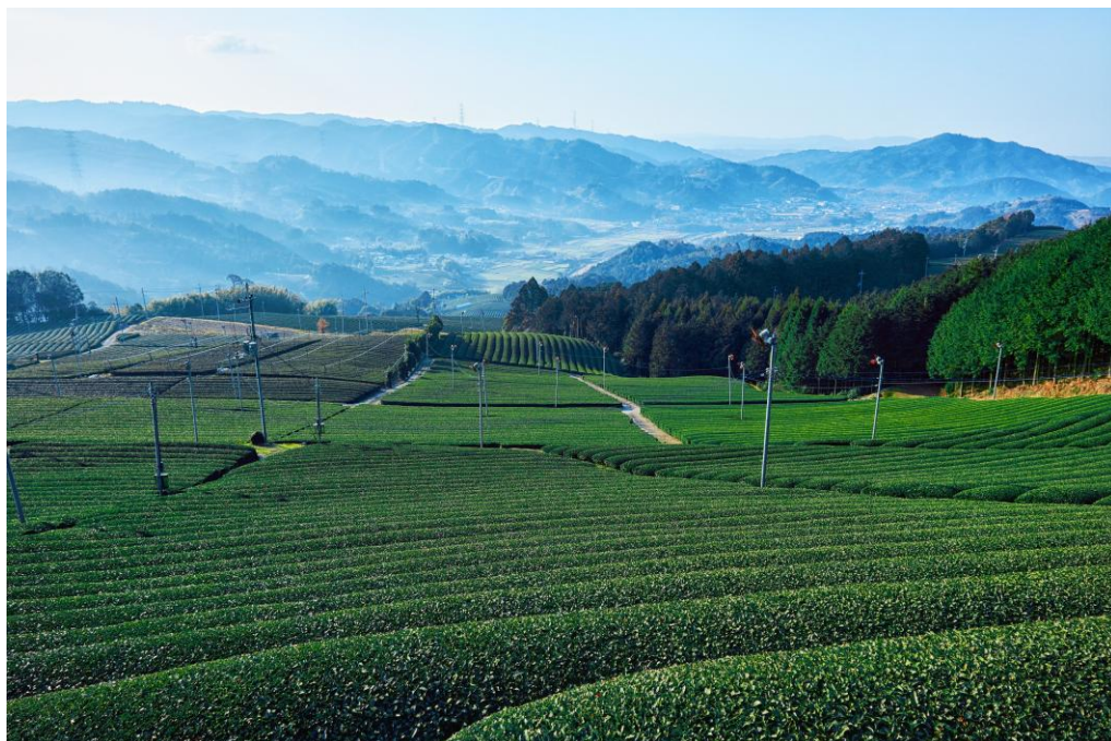
『京都宇治 和東町 茶畑』イメージ