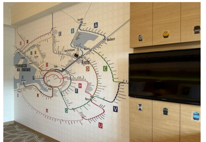
(写真左右)『リーガ トレインルーム 776系』イメージ