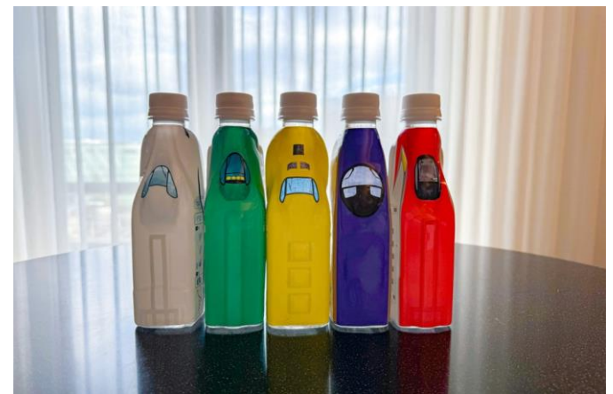
トレインボトルウォーター イメージ