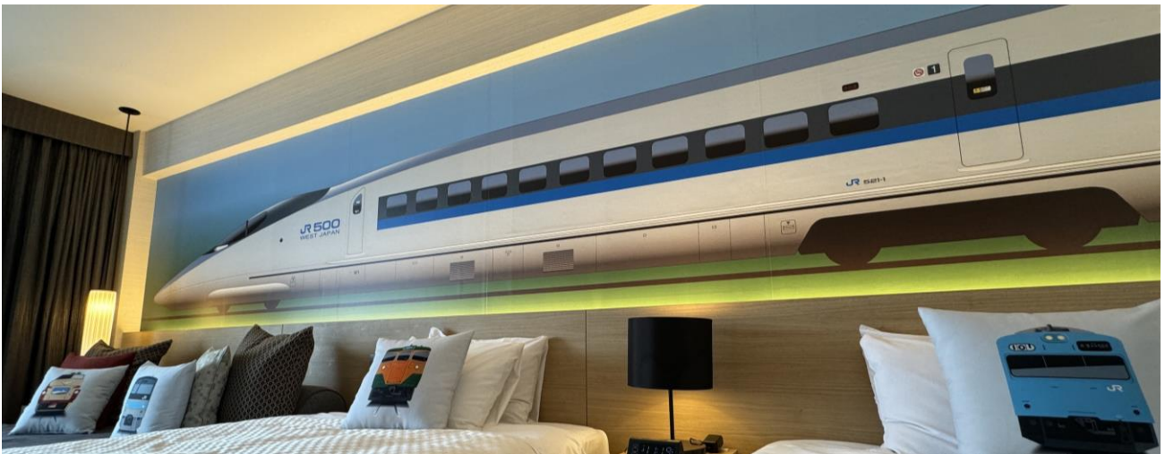
『リーガ トレインルーム 776系』イメージ