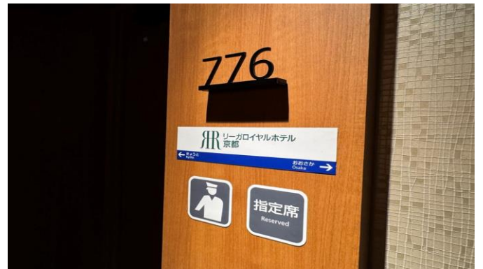
ピクトグラムサイン イメージ