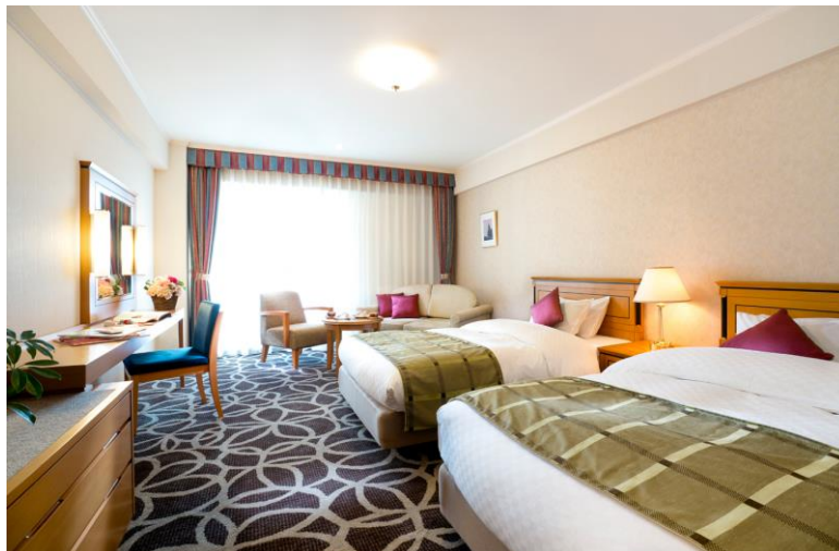
エグゼクティブフロア デラックスツインルーム イメージ

リーガロイヤルホテル京都(京都市下京区東堀川通り塩小路、総支配人 藤井 友行)は、包括的なプロセスで室内環境を清浄化しクリアな状態を維持する『Pure wellness room』を導入し、2024年4月30日(火)より予約受付開始、5月7日(火)から販売を開始します。