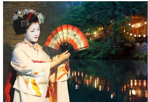
「もみぢ家」イメージ