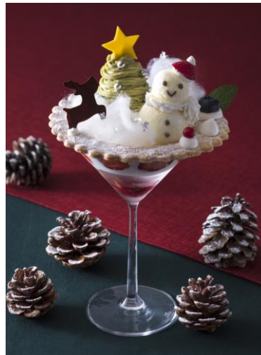
クリスマスパフェ「Noël blanc」イメージ