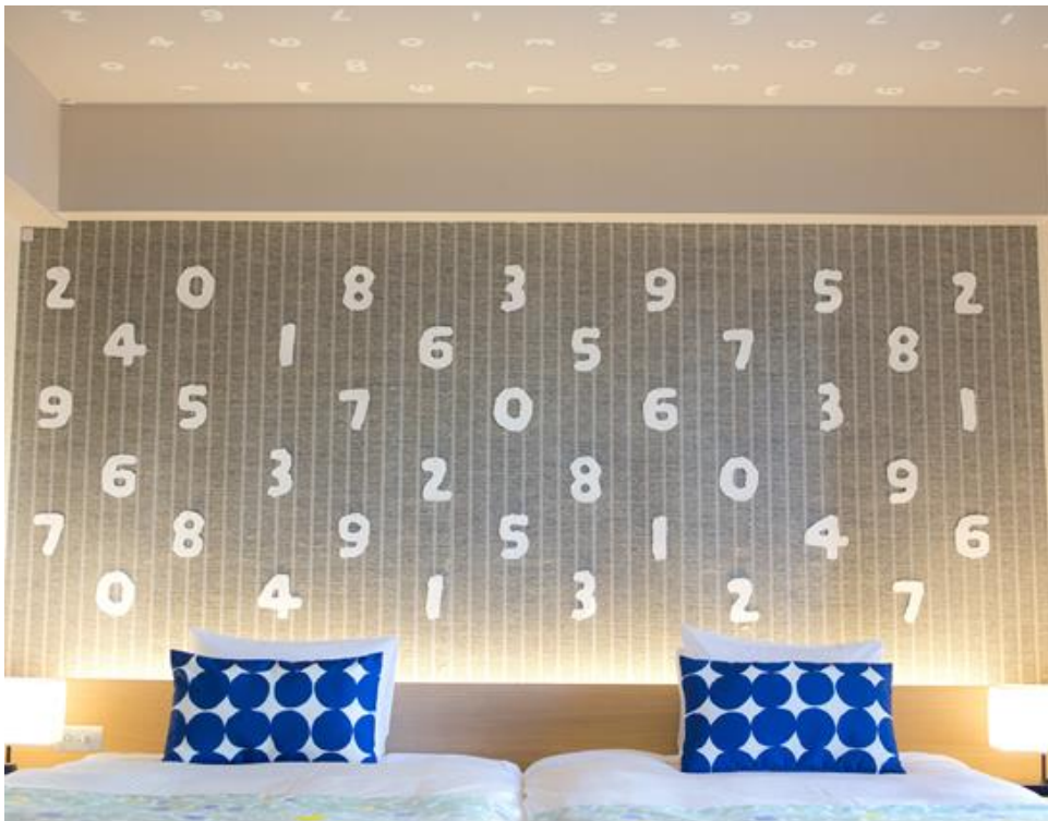
天井にまで SOU・SOU で人気の SO-SU-U(そすう)柄が登場