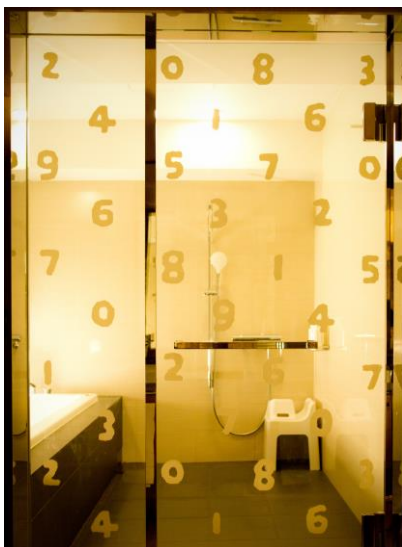
【バスルーム】(写真左)

全面ガラスのバスルーム扉にも「SO-SU-U」が散りばめられ、お風呂に入るのが楽しみになります。