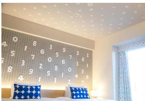
【天井:蓄光シール(昼)】