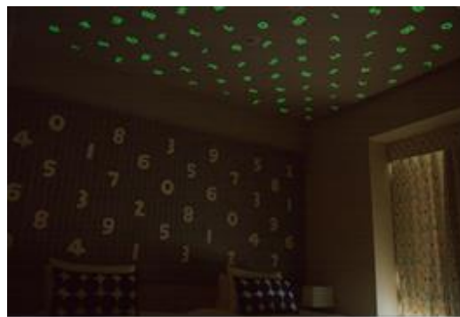
【天井:蓄光シール(夜)】

お部屋を暗くすると、SO-SU-U(そすう)柄が光り、 夜になるのが楽しみになる仕掛けです。