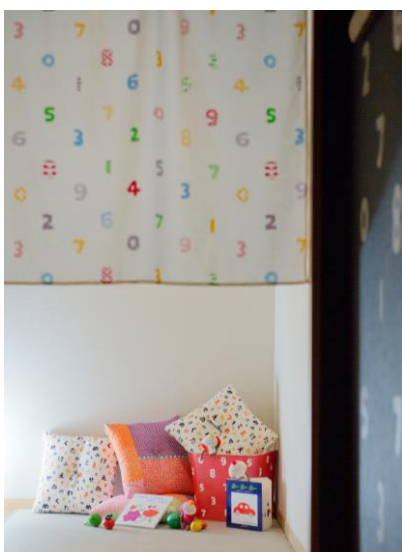
【お子様スペース】(写真左)