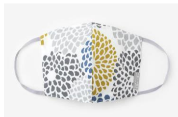
高島平織×高島縮テキスタイルマスク