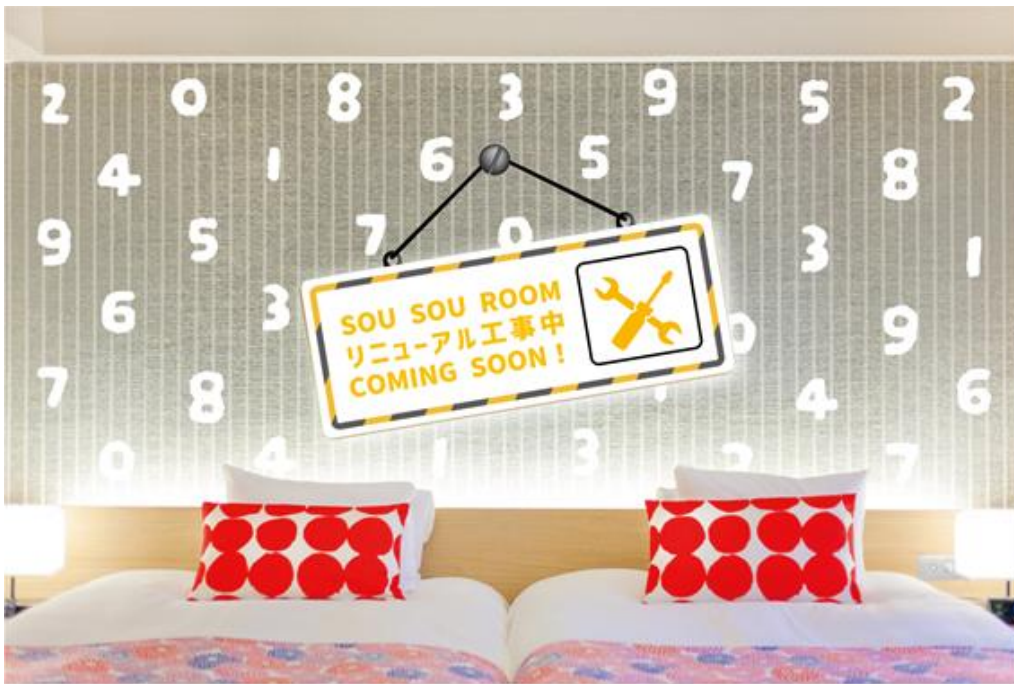
「SOU・SOU ROOM」リニューアル準備中 イメージ