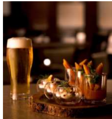
↑ ビュッフェ料理イメージ