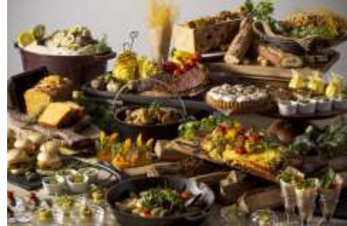
↑ビュッフェ料理イメージ