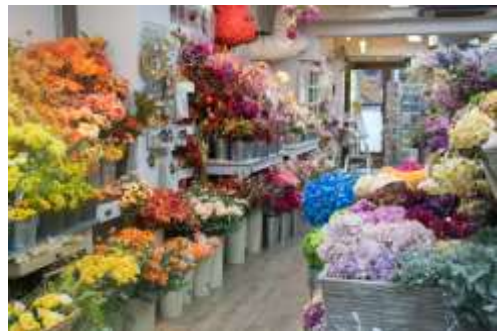
サンエイクラフト 仏光寺店