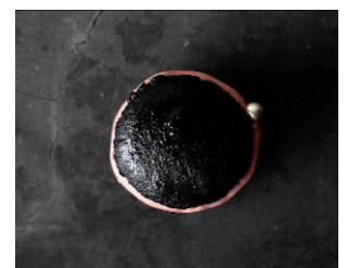
↑紅環日食をイメージした 「ギャラクシートウンカロン」 真上から見たイメージ