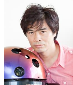
↑プラネタリウム・クリエイター大平貴之氏

小学生の頃からプラネタリウムの自作に取り組み、学生時代にアマチュアでは例のないレンズ式投影機の開発に成功。1998年、従来の100倍以上にあたる170万個の星を映し出す「MEGASTAR」を発表し話題に。2004年、「MEGASTAR-II cosmos」がギネスワールドレコーズに認定された。2005年に有限会社大平技研を設立。国内外施設へのMEGASTAR設置の他、大型イベントやアーティストとのコラボレーションなどでプラネタリウムの可能性を切り開き続けている。2018年にはIPS（国際プラネタリウム協会）の「テクノロジー&イノベーションアワード2018」を受賞。直径500m級の巨大ドームに投影可能な新型プラネタリウム投影機「GIGANIUM（ギガニウム）」を開発し、2019年にはメットライフドームで1万人が同時鑑賞した史上最大プラネタリウムを実現。