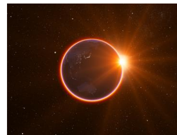
↑数量限定特典の『紅環日食（月からみた皆既月食）原板』

セガトイズ.comで8月12日に新発売する『ホームスター』を購入すると、未だかつて誰も見たことがない、月面から見た皆既月食中の地球を再現した原板がついてきます。ホームスター共同開発者の、プラネタリウム・クリエイター大平貴之氏が制作し、大平貴之氏はこの現象を「紅環日食」と名づけました。『紅環日食（月からみた皆既月食）原板』は、数量限定の特典のため、なくなり次第終了。