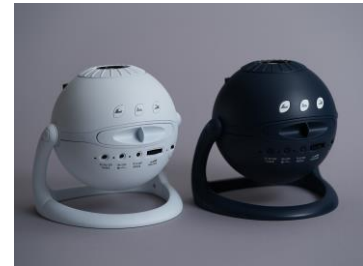
↑セガトイズ2021年8月新発売「Homestar」

従来よりも、速く細く流れるリアルな流星を再現しました。それにより、自然の中で流星を見ているかのような、楽しみが生まれました。