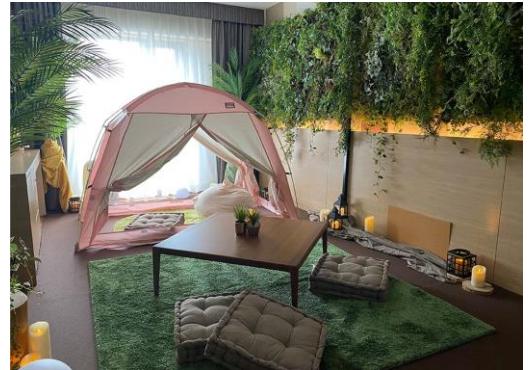
↑ 星空グランピング装飾ルーム イメージ

※4名様利用の場合は1室2名様の間を2部屋ご用意します。 星空グランピング装飾ルームは1室のみです。