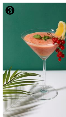
③ 「Miel Rouge(ミエル ルージュ)」