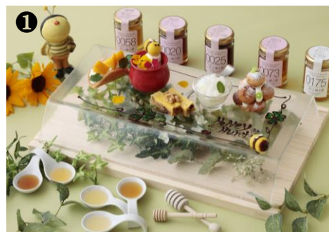
「ハニーハント」イメージ

※上記メニューは全て蜂蜜を使用しておりますので、1歳未満の乳児には与えないでください。