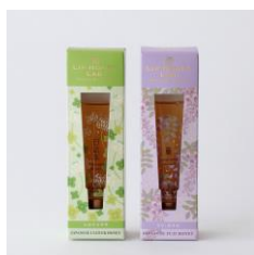
↑「LIP HONEY LAB.」