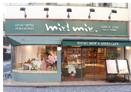
「蜂蜜専門店ミールミィ」三条本店

蜂蜜酒は 10 年以上前から全国で先駆けて輸入し、取扱い国、種類は国内随一。2020 年 6 月で創業 90 周年を迎えた。