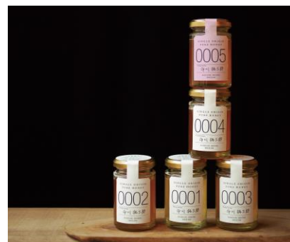
シングルオリジンハニー イメージ

蜂蜜は「蜜源、場所、時期」などによって味わいがそれぞれ異なります。その異なる“オリジン”を持つ蜂蜜を、個性そのままに瓶詰したのが「シングルオリジンハニー」。ハニーハンター いちかわたくさぶろう 市川拓三郎氏が世界中からいろいろな蜂蜜を集め、世界 20 か国、日本 20 都道府県以上から 100 種類を超える蜂蜜を取り揃えています。