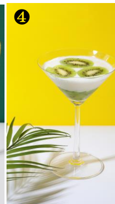
④ 「Miel Blanc(ミエル ブラン)」イメージ