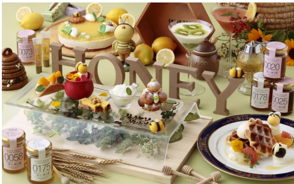
ハニーハンター厳選のはちみつとスイーツのコラボレーション「ハニーハーモニー」イメージ