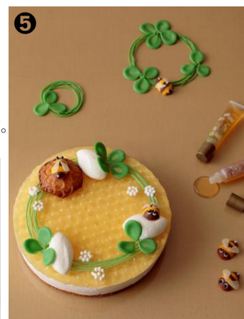
↑「はちみつレモンのチーズタルト(LIP HONEY LAB.付)」イメージ