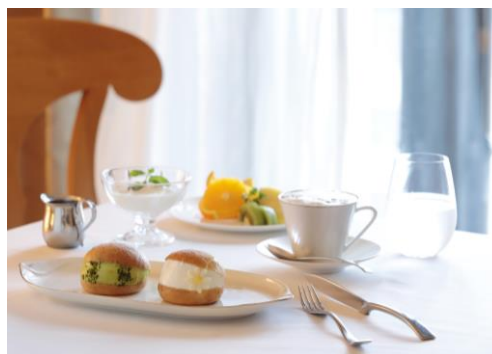
ルームサービス イメージ