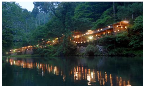
「もみぢ家」イメージ