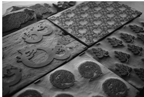
↑ 江戸時代から受け継がれてきた板木