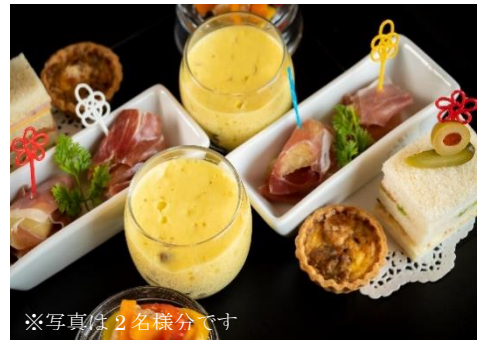
※写真は2名様分です