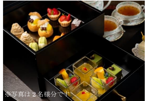
※写真は2名様分です