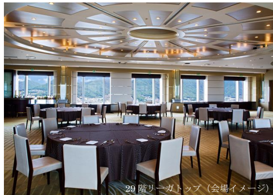
29階リーガトップ(会場イメージ)