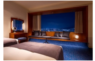
エグゼクティブフロアツイン (イメージ)

《一例》33階レストラン特別朝食(洋食または和食) / インルームチェックイン / ティーセット(1名様1セット) / レイトチェックアウト 12:00(通常 11:00) ほか多数