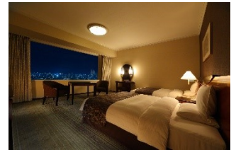
スーペリアフロアツイン (イメージ)