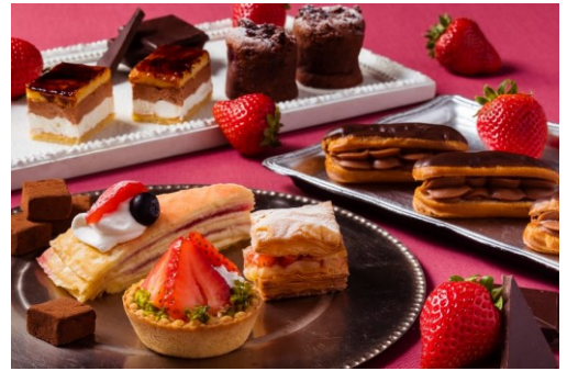
スイーツビュッフェ (イメージ)