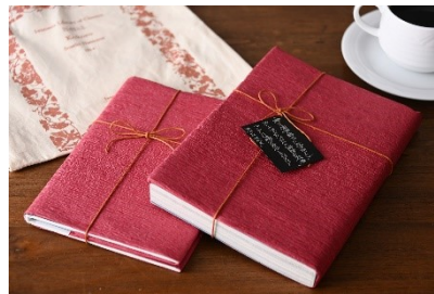
シークレットブック (イメージ)