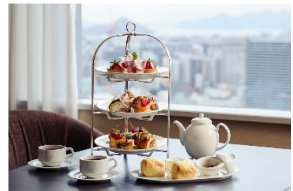
アフタヌーンティーセット (イメージ)