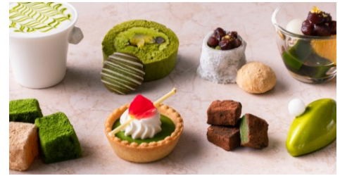
スイーツビュッフェ (イメージ)