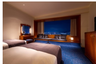
エグゼクティブフロアツイン (36㎡)