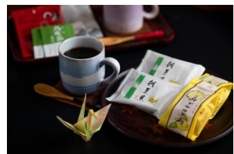
ティーセット (イメージ)