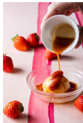
温かいイチゴのフランベ (イメージ)