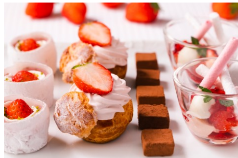
スイーツビュッフェ (イメージ)