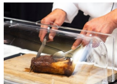
衛生対策を徹底したうえで、料理を提供

https://www.rihga.co.jp/hiroshima/notice-202008