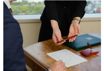
インルームチェックイン (イメージ)