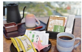
ティーセット (イメージ)