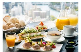
タルティーヌ ブレックファスト (イメージ)