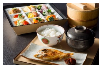
重膳和朝食 (イメージ)