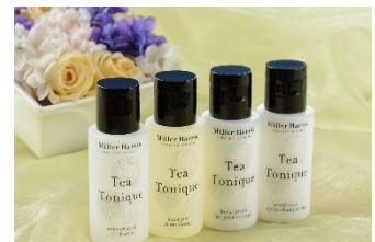
バスアメニティ (イメージ)

ロンドンで誕生したメゾンフレグランス。アメニティにはティートニックのフレグランスを使用しており、イギリスで飲む香り高い紅茶のようなテイストを彷彿とさせます。