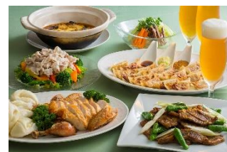
料理イメージ ※写真は6名様分の盛り合わせです。