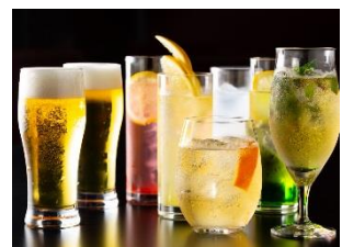
3 種のビールほか、アレンジ酎ハイなどを多数をご用意(イメージ)