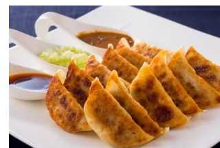
食べ放題の「焼き餃子」(イメージ)