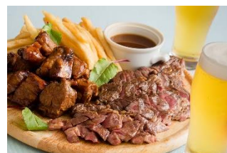
メインディッシュ(イメージ) ※写真は6名様分の盛り合わせです。