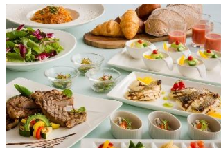
ビュッフェ(イメージ)