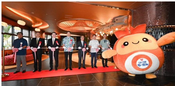
テープカットには、北谷町イメージキャラクターの「ちたん」が登場

株式会社ロイヤルホテル（大阪市北区中之島、代表取締役社長 植田 文一 うえだ ぶんいち ）は、展開するリーガロイヤルホテルズ初のコンドミニウムホテル「リーガロイヤルリゾート沖縄 北谷 ちやたん 」を、本日2026年4月1日（水）に開業し、記念式典を執り行いました。