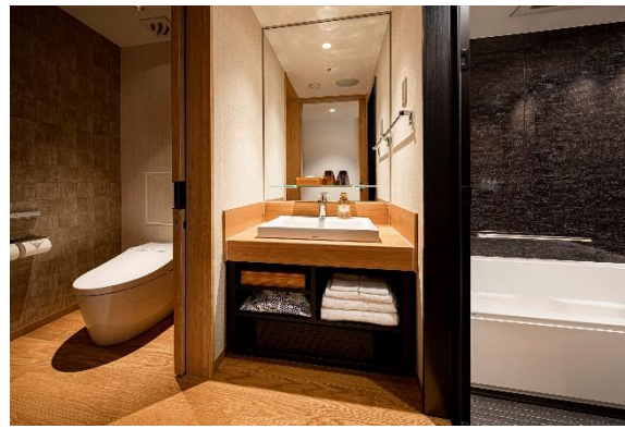
スタンダードツイン 洗面・バス・手洗い