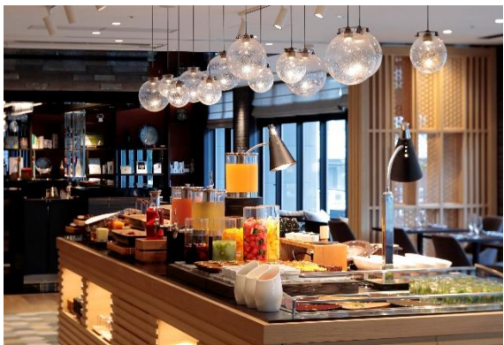
Dining&Lounge KOTONA ご朝食