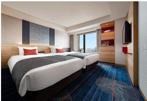
スタンダードツイン