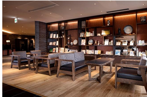
宿泊者専用ラウンジ(10:00～17:30)